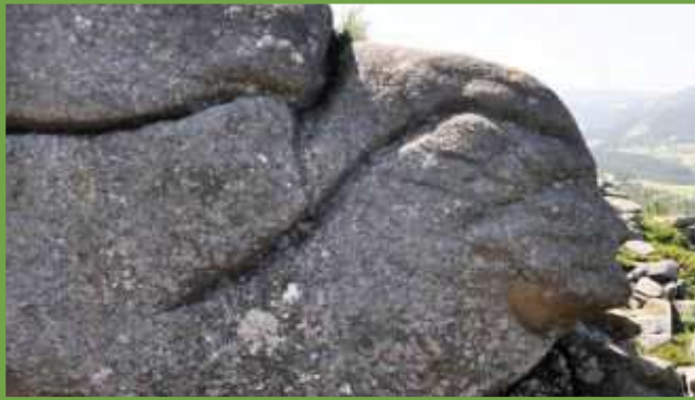
Escola de Pasarela