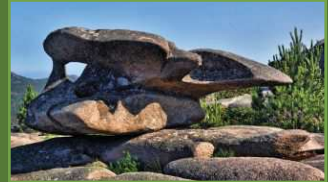
Zona da Forcada